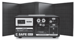
防災用ポータブル蓄電池 E-SAFE RIKU

弊社は佐賀市内で蓄電技術を使った製品の開発・製造をしています。 E-SAFE RIKUは災害時に必要な電気を安心して使えるポータブル蓄電池です。 ①安心の国産ポータブル蓄電池②長期保管が可能③国産だからできる安心のサポート体制ですすでに九州内の自治体・官公庁に現在35カ所導入頂いています。 ソーラーパネルも同梱で停電が長引いても安心です。 また医療機器との接続実績もあり、災害時に「命と生活を守る」ためにご提案を行っています。