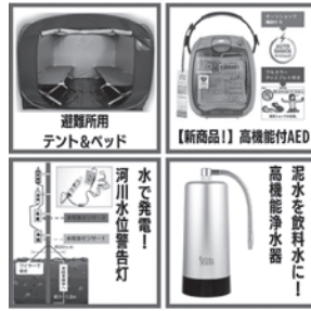
避難所用の商品等、厳選した商品です。

熊本地震での死者数の約8割が避難生活を通じた心身不調等で亡くなった「災害関連死」です。避難所での生活を少しでも楽にできる商品や、避難の目安となる商品をご案内させていただきます。弊社は熊本で創業し約60年、人々の暮らしの中心である、「水」と「住環境」を整える薬剤や、「人命」に直結するAEDや防災商品の販売を行ってまいりました。今回は、予算が確保しやすい低価格の商品を厳選して紹介させていただきます!