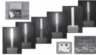
夜間の避難所にやさしい光で安堵感

災害による避難所への緊急避難も多くなっています。避難所での生活環境は不自由で特に夜間は安眠できない、トイレや家族の居場所がわかりづらい等でお困りの声も多く聞こえます。そこで、睡眠の妨げにならない優しい光と色分けで居住空間や生活導線を照らし、不安を軽減させる照明「ポールCUBE」を紹介いたします。また、集団生活での不快な生活臭等を軽減する除菌効果もある無添加無香料の天然消臭剤「現場消臭」も紹介します。