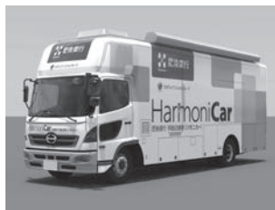
肥後銀行移動店舗車「ハモニカー」

肥後銀行では2台の移動店舗車「HarmoniCar」(ハモニカー)を導入しています。本車両は、お客さまの利便性向上と災害発生時BCP対応を目的とし、店舗の少ない地域や各種イベント会場など、さまざまな場所で金融サービスをご提供いたします。また、災害発生時には緊急対応車両としてATMでの現金供給や搭載発電機による電源供給など地域の皆さまにお役立ちいたします。