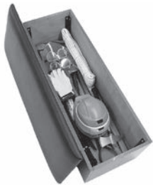
ベンチ収納型の災害時常備救助セット。

ショベル（スコップ）、テコバール、ハンマー、担架などの救助用品から、一輪車、清掃用品などの復旧用品、命を守る避難BOX、水害対策用品など様々なツールをご紹介します。 人命救助に当たっては、「生死を分けるタイムリミットは72時間」といわれていますが、いかに災害救助道具の備蓄（初動）が大切であるかを示しています。しっかりとした備えで、安心安全な日常を過ごしましょう。