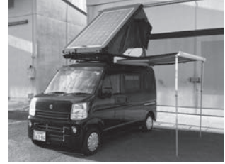
愛車にセット出来るルーフテントです

日常生活で普通に使える軽キャンピングカーOKワゴンは、ソーラーパネル、サブバッテリー、ベッドなど備えており災害時にも活躍します。また、愛車に工具不要で簡単にセット出来るベッドキット、2段ベッドキットがあればエコノミー症候群の心配もありません。愛車の屋根にセット出来るルーフテント、サイドウォールなども展示します。今回デモカーを展示しますので、実際に横になったり体感してください。