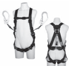
レヴォハーネス ツインコルトリトラ付き

藤井電工は「安全は愛」(Safety is Love)をモットーに世界クラスの製品作りを目指します。 弊社は創業以来60年余の長きにわたり一貫して高所作業における墜落防止（安全）と能率の向上をテーマに、専門化されたプロユースのための様々な製品を世に送り出してきました。 あらゆる高所作業における安全と能率を総合的なシステムとして提供できる世界で only one の企業です。 ぜひ一度弊社の製品をご覧ください。