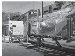
耐衝撃性試験(300kg鉄球)の様子