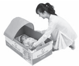
Combi ひなん所用コットHB11 ベビーにこっつ（3個入）

「大人用の段ボールベッドはあるのになぜ赤ちゃん用がないのだろう。」そんな想いからコンビウィズはベビー用品メーカーとして、防災備蓄用段ボール製ベビーコットを開発しました。 工具なしで組み立て可能で1箱に3個入り。宅配便対応サイズでコンパクトに備蓄できます。 避難所でも赤ちゃんの安眠を確保できる構造にこだわり、速乾性のあるパッドやほごり等をよける幌付きとなっています。