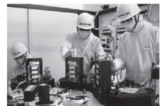
ベルフォアジャパン社の復旧作業工程

保険会社の仕事は保険金のお支払いで、おしまいと思いませんか? 災害がいつ起こるかわからないこのご時世、被災してから日常業務に戻るまでの早期復旧がカギとなります。弊社は世界28カ国に240拠点を持つ災害復旧の専門会社であるドイツ発祥のベルフォアグループと共同出資を行い、ベルフォアジャパンを設立しました。災害や事故で被害を受けた機械・設備・工場・社屋等の復旧のスペシャリストの技をぜひご覧ください。