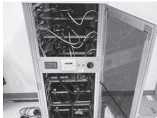
エルバス・停電時予備電源として使用します

介護施設などに設置をされています再加熱カート、飲食店などに使用されている大型冷蔵庫など大きな電気を出力する200V三相商品向けに開発致しました。停電時90%は約4時間程度で復旧します。その4時間分を補えるようにすることができるのがこのバックアップ電源となっております。最大出力は10.5KWで容量は26.88KVAとなっております。また、オプションで100V電源も使用できるようになっております。