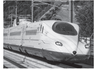
西九州新幹線N700S「かもめ」

2022年9月23日に西九州新幹線 武雄温泉～長崎間が開業しました。博多から長崎まで最速1時間20分、西九州への旅がますます便利になりました。また昨年度スタートした列車荷物輸送サービスも、お取り寄せ通販サービス「つばめマルシェお取り寄せっ!便」の開始やバスとのリレー物流、宅配事業者との連携などサービス拡大中です!