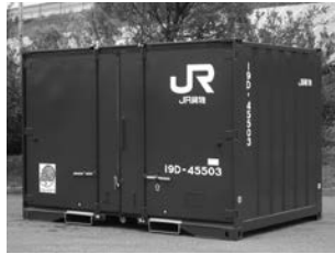
12フィートコンテナ、積載重量は5トン

CO 2 の排出量が少なく環境に最もやさしい輸送手段であり、深刻化しているトラックドライバー不足対策にもなる「鉄道コンテナ輸送」の仕組みや特長を、パネルと映像でわかりやすく紹介します。また、普段見ることのできない貨物駅を配置したNゲージのジオラマを展示します。 クイズラリーに参加された方にはもちろん記念品を差し上げますので、ぜひお立ち寄りください。