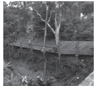
特殊伐採、法面伐採、造園工事等効果抜群!

エイハン・ジャパンは創業以来22年、高所作業における商品、技術、サービスを提供し、お客様の安全と業績、生産性向上に貢献してきたメーカーです。業界随一のラインナップでお客様の「困った」に必ずお応え致します。今回は地域に特化した商品を紹介しております。中でも特殊伐採に力を発揮するブルーリフト、一台で数役の主に農作業をこなすテレハンドラーを是非体感ください。